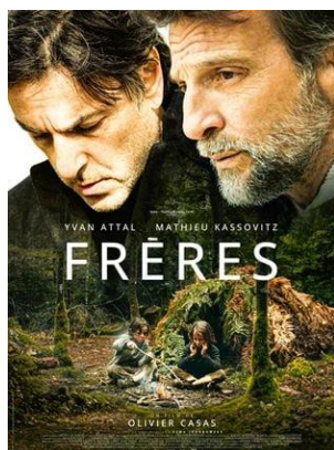
« Frères »

L'histoire vraie de deux petits garçons de 5 et 7 ans qui, abandonnés par leur mère en 1948, s'enfuient dans la forêt. Ils vont y survivre pendant sept années et tisser un lien qui les unira à jamais. Des décennies plus tard, les deux frères quittent tout pour se retrouver. Mais le passé et les secrets les rattrapent, même à l'autre bout du monde.