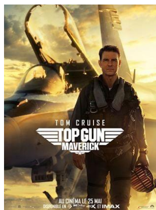
« Top Gun, Maverick »

Après avoir été l'un des meilleurs pilotes de chasse de la Marine américaine pendant plus de trente ans, Pete "Maverick" Mitchell continue à repousser ses limites en tant que pilote d'essai. Il refuse de monter en grade, car cela l'obligerait à renoncer à voler. Il est chargé de former un détachement de jeunes diplômés de l'école Top Gun pour une mission spéciale qu'aucun pilote n'aurait jamais imaginée. Lors de cette mission, Maverick rencontre le lieutenant Bradley "Rooster" Bradshaw, le fils de son défunt ami, le navigateur Nick "Goose" Bradshaw. Face à un avenir incertain, hanté par ses fantômes, Maverick va devoir affronter ses pires cauchemars au cours d'une mission qui exigera les plus grands des sacrifices.