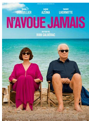
« N'avoie jamais »