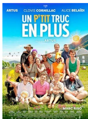
« Un p'tit truc en plus »

Pour échapper à la police, un fils et son père en cavale sont contraints de trouver refuge dans une colonie de vacances pour jeunes adultes en situation de handicap, se faisant passer pour un pensionnaire et son éducateur spécialisé. Le début des emmerdes et d'une formidable expérience humaine qui va les changer à jamais.